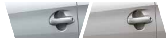
Bạc 1D4 Nâu vàng 4R0