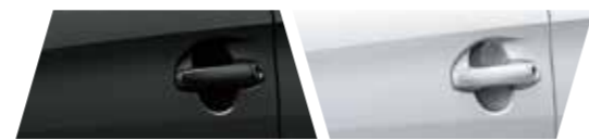
Đen 218 Trắng 040

*VIOS J chỉ có 3 màu: Bạc, Nâu vàng và Đen.