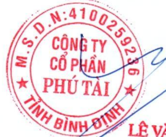
Võ Phương Thảo